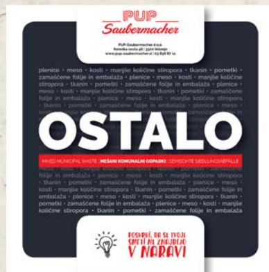
MEŠANI KOMUNALNI ODPADKI